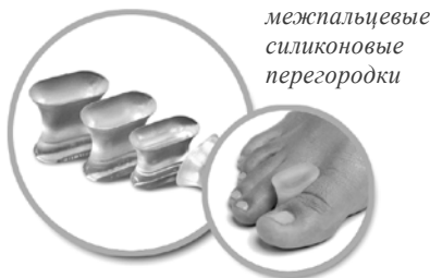
межпальцевые силиконовые перегородки

Подарите своим ногам комфорт, легкость и радость движения – используйте силиконовые изделия для стопы и приспособления из полимерного геля.